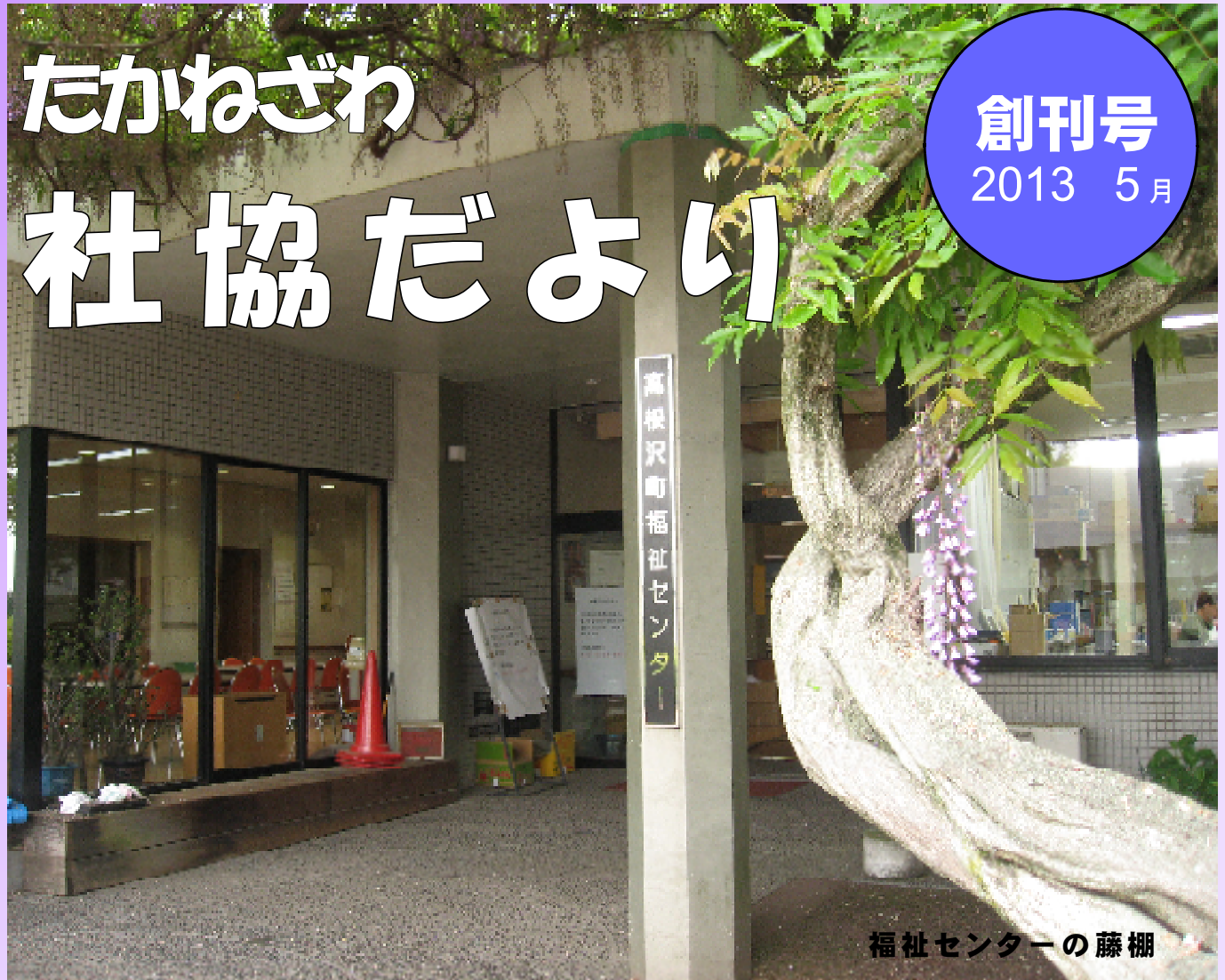
福祉センターの藤棚