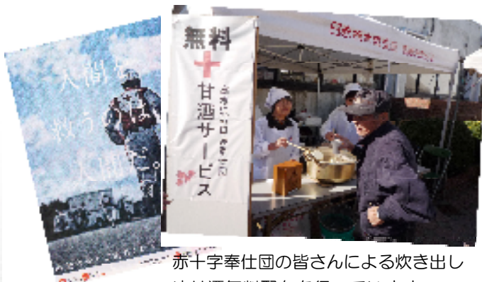
赤十字奉仕団の皆さんによる炊き出しや甘酒無料配布を行っています。

赤十字活動を詳しく知りたい方は 日赤栃木県支部 028-622-4327 日本赤十字社HP www.jrc.or.jp