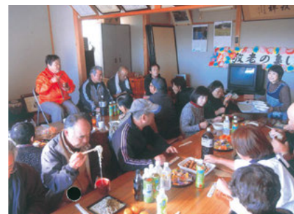
伏久行政区 （新そばまつりでの交流会）