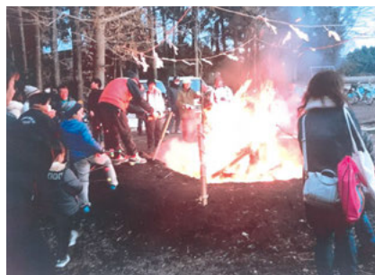
東高谷子供会育成会 （どんど焼き）