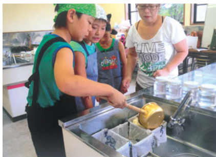
花岡西下育成会 （スクールガードさんへ 日頃の感謝を込めて豆腐づくり）