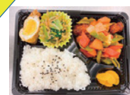
いぶき配食サービスぐりーん